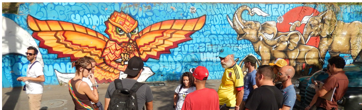
Figura 2. (2016). Graffiti de los pañuelos blancos.

"Los muros de la Comuna 13 de Medellín que se ven en el Graffitour hablan de la unión de los habitantes de este sector del occidente de la ciudad." (Uribe, 2016)