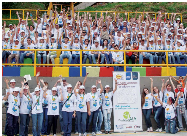
Figura 3. (imagen de la izquierda) (2015). Proyecto Medellín se pinta de vida.