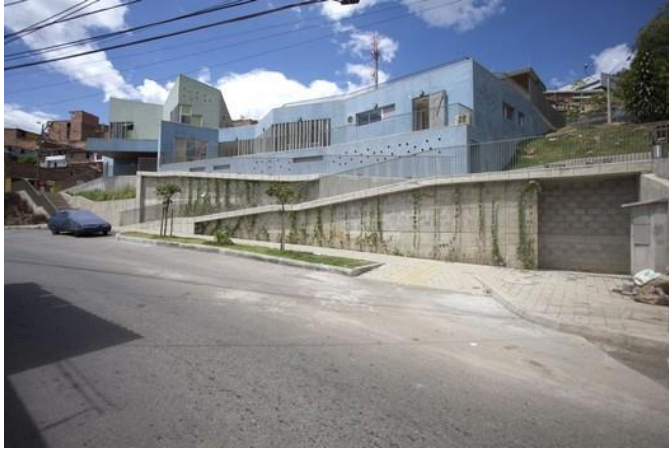
(Santo Domingo Savio Kindergarten)