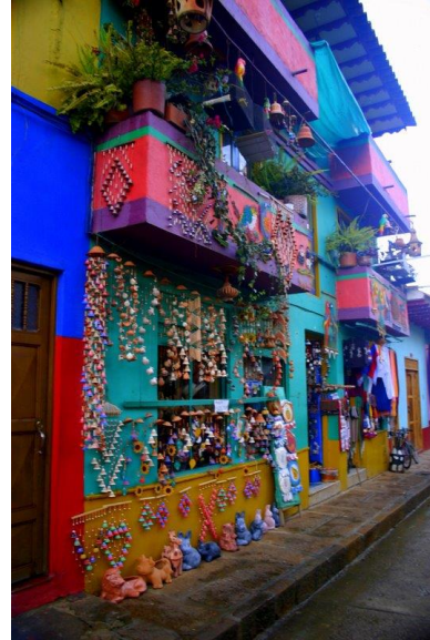
(Ráquira, Boyacá, Colombia)