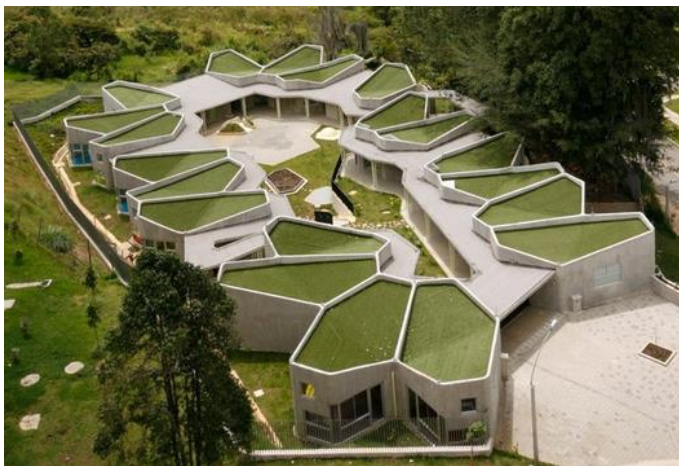
(La Aurora, Jardín Infantil Pajarito)