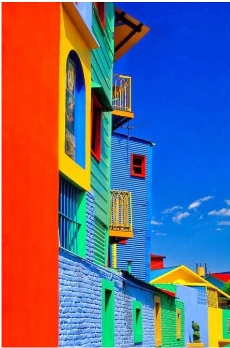
(Caminito, Buenos Aires, Argentina)