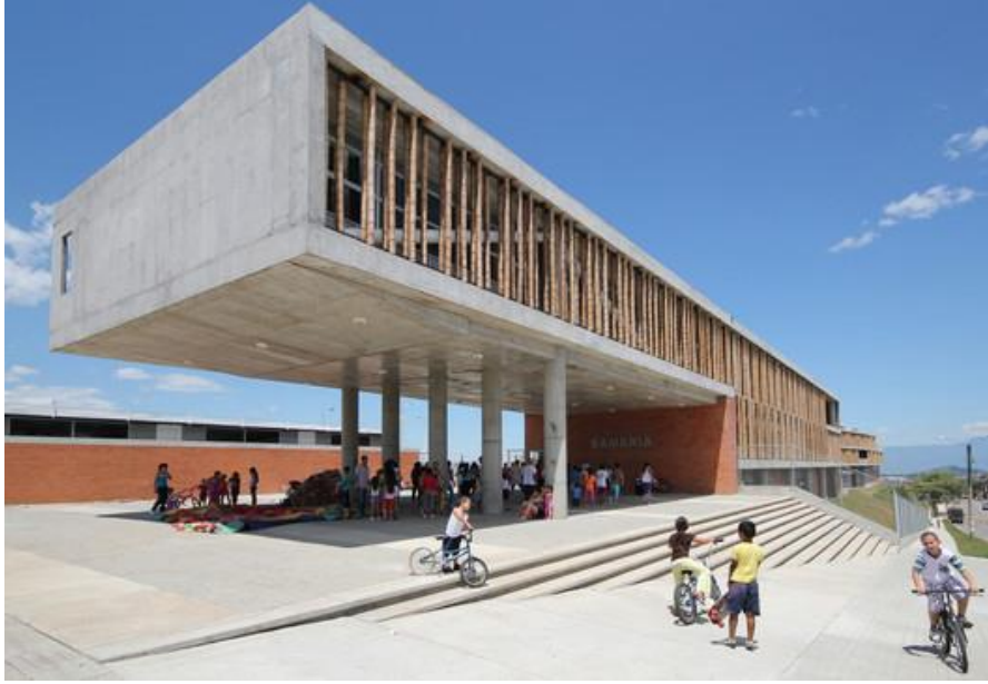
(Institución Educativa La