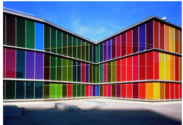
(Museo de Arte Contemporáneo de Castilla y León)