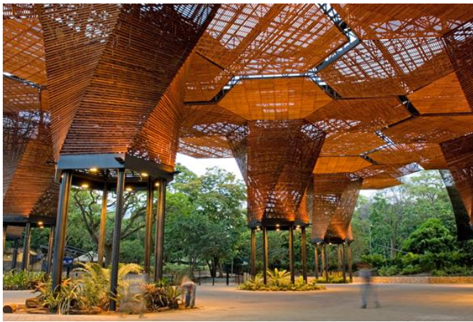
(Orquideorama, Jardín Botánico)